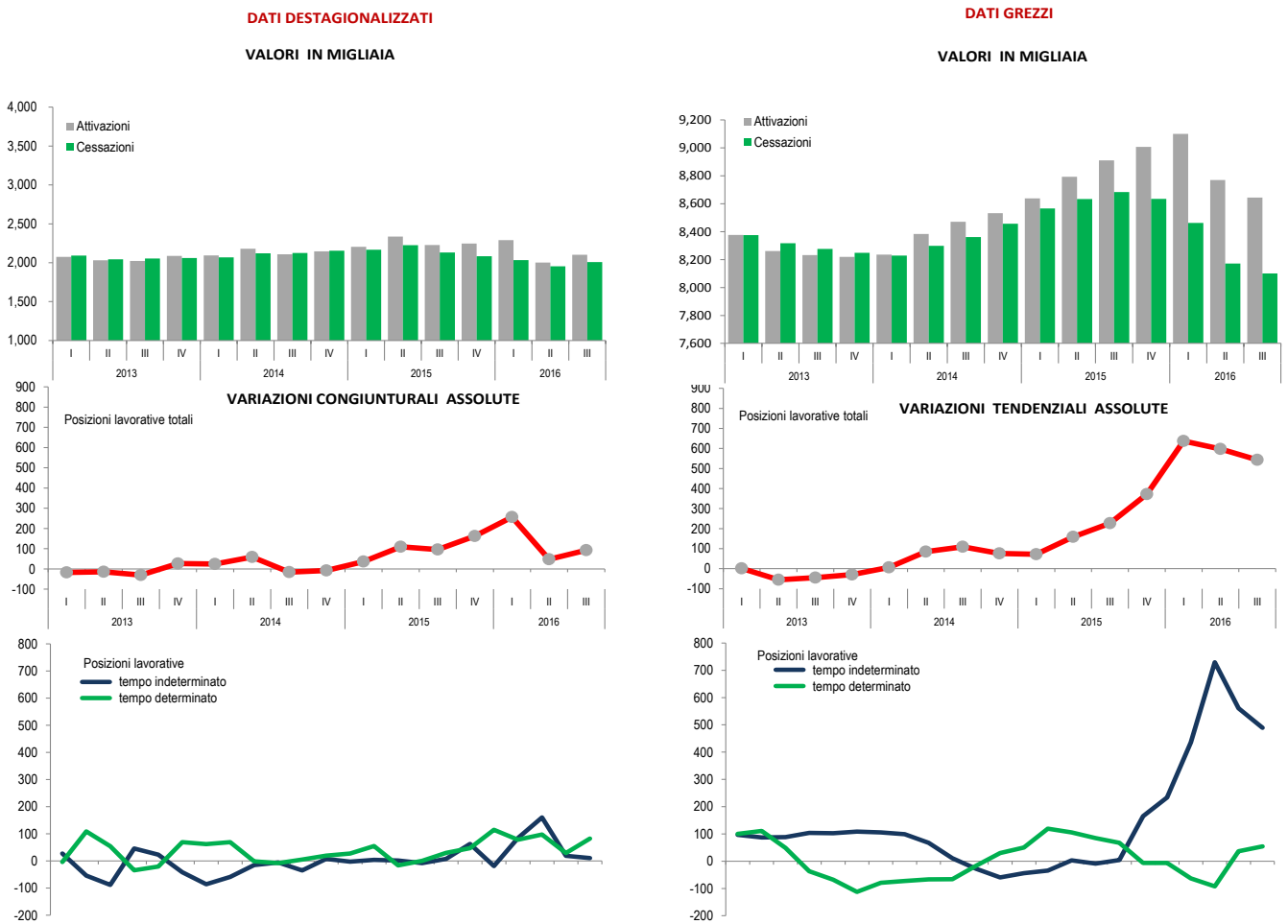
FIGURA 1 ATTIVAZIONI E CESSAZIONI, POSIZIONI LAVORATIVE DIPENDENTI PER TIPOLOGIA DI CONTRATTO DELL'OCCUPAZIONE. I trim. 2013 – III trim. 2016, valori assoluti e variazioni assolute